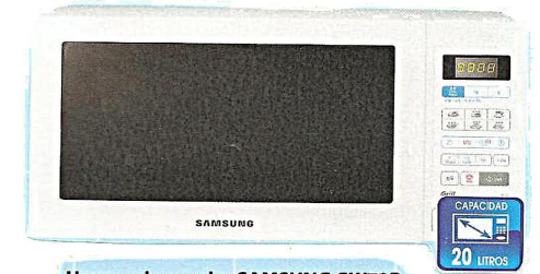
Horno microondas SAMSUNG GW73B. Con grill simultáneo, mandos digitales,