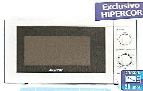
Exclusivo HIPERCOR Microondas ANSONIC MAMG2010. Temporizador hasta 3 min, con grill,