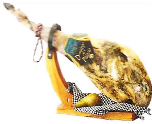
Jamón ibérico de cebo DOMINGO DEL PALACIO. Pieza de 7,5 a 8,5 kg.