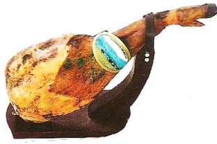
Productos ibéricos de cebo CUMBRES IBÉRICA. Jamón, pieza de 7,8 a 8,2 kg (1). Paleta, pieza de 4 a 5 kg (2).