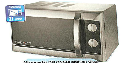
Microondas DELONGHI MW500 Silver Análogo, grill simultáneo,